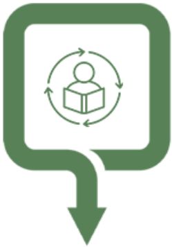
یادگیری در میدان