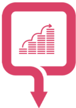
برنامه‌های فشرده متمرکز