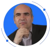
دکتر جعفر زنگنه