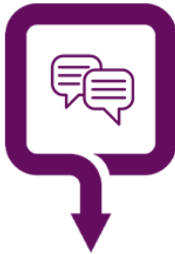
داستان یک مشاور